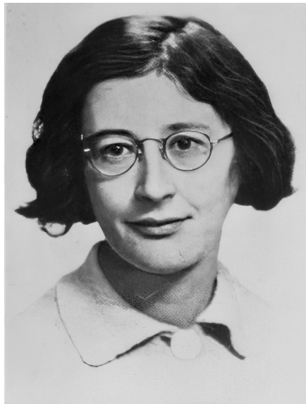
Simone Weil (anonyme, 1942)